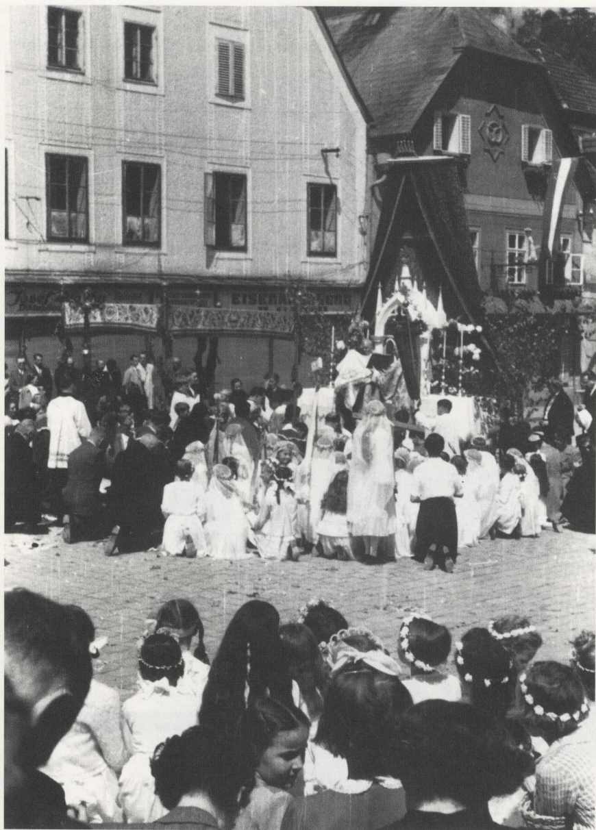
„Fronleichnamsssegn für Stadt und Land“ beim Altar auf dem Unteren Stadtplatz; 1953