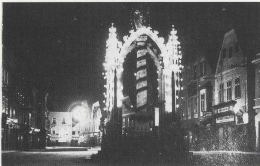
Öllichter um die Mariensäule auf dem Oberen Stadtplatz am Vorabend des Fronleichnamsfestes; bis 1937