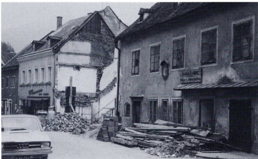
Bild 5 Umbau am Hohen Markt (1968). Das neue Geschäft für Buxbaum entsteht.