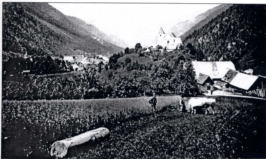
Helm's photo. Kunstler, Wien.