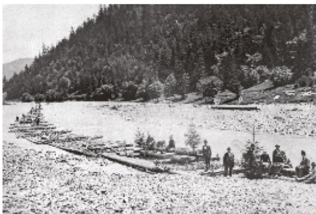
1. März 1866: Das erste Ybbs-Floß ist startklar.

Die unternehmerischen Aktivitäten begannen im Frühjahr 1866: Die Dampfsäge in Amstetten war erbaut, und erstmals sollte der auf die Ybbs gestützte Transport von Langholz ins Werk gesetzt werden. Unterhalb von Hollenstein hatten 14 Schiltacher Flößer unter Leitung von A. Koch ein aus 33 Gestören mit 600 Stämmen bestehendes Floß startklar gemacht. Die Fahrt war für den 1. März angesetzt, Ziel war das 25 km flussabwärts gelegene Waidhofen. Da gezeigt werden sollte, dass