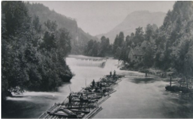
Ein Floß hat das Schüttwehr oberhalb Waidhofens passiert (um 1873).

glückliche Weiterkommen über die Wehren, d. i. über die Wasserschwellen der hiesigen Schmiede und Schleifer, fürchtete man, und zwar mit Recht, weil sie einen gewaltigen Wasserfall bilden. Man hat früher den Einfall für lächerlich gefunden, über eine Wehre mit Flößen fahren zu wollen; doch die Industrie der Ausländer (Elsässer und Schwaben) hat uns zu Schanden gemacht. Alle Herzen schlugen dem Augenblick entgegen, in welchem die Flöße im Angesichte Waidhofens über die großen Wehre gleiten würden. Man konnte ein gewisses Gefühl des Grauens und der Bangigkeit nicht unterdrücken, und fromme