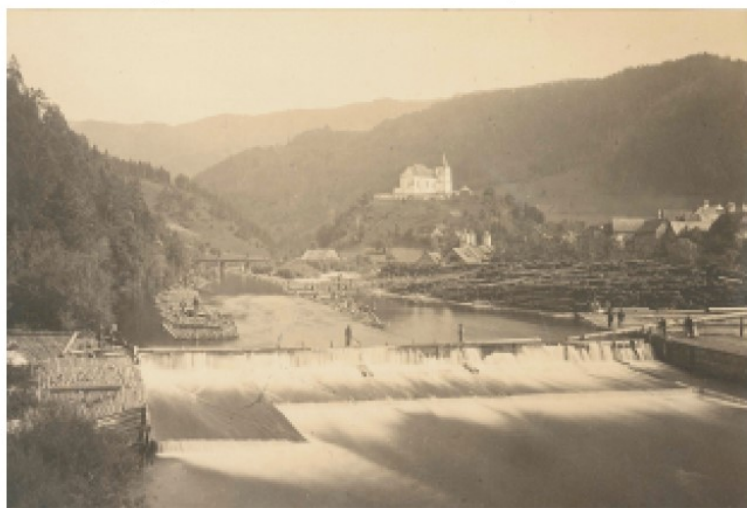
Die Einbindstätte mit Wehr, Gamper und Rutsche bei Hollenstein (um 1873).