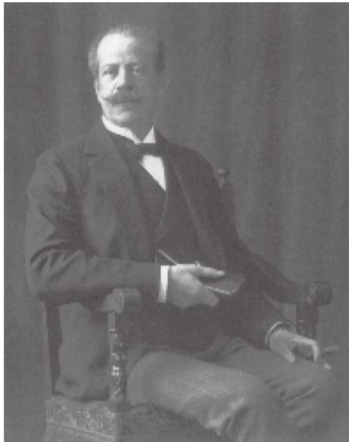
Freiherr Albert von Rothschild

Wiewohl von kompetenter Seite prognostiziert wurde, dass „der Bedarf an Holz von Jahr zu Jahr wächst und die Nutzholzpreise [...] einer immerwährenden, wenn auch langsamen Steigerung durch ganz Europa sich zu erfreuen hatten“, 51 geriet auch die Actien-Gesellschaft für Forstindustrie in den Sog des Wiener